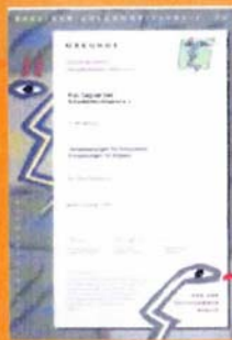
Berliner Gesundheitspreis 1995