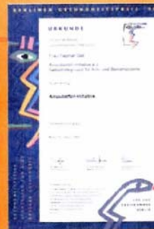
Berliner Gesundheitspreis 1998