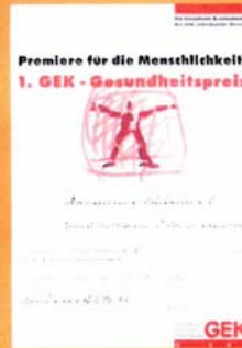
1. GEK – Gesundheitspreis 1995