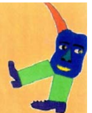
Dr. Richard von Weizsäcker Bundespräsident a.D.